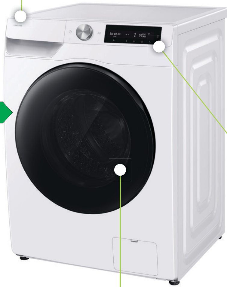
Display AI Control®